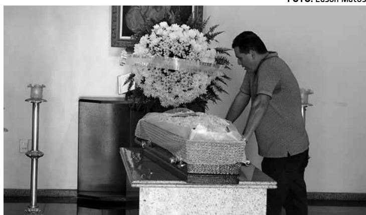
Jornalista e publicitário morreu domingo, no Hospital Samaritano