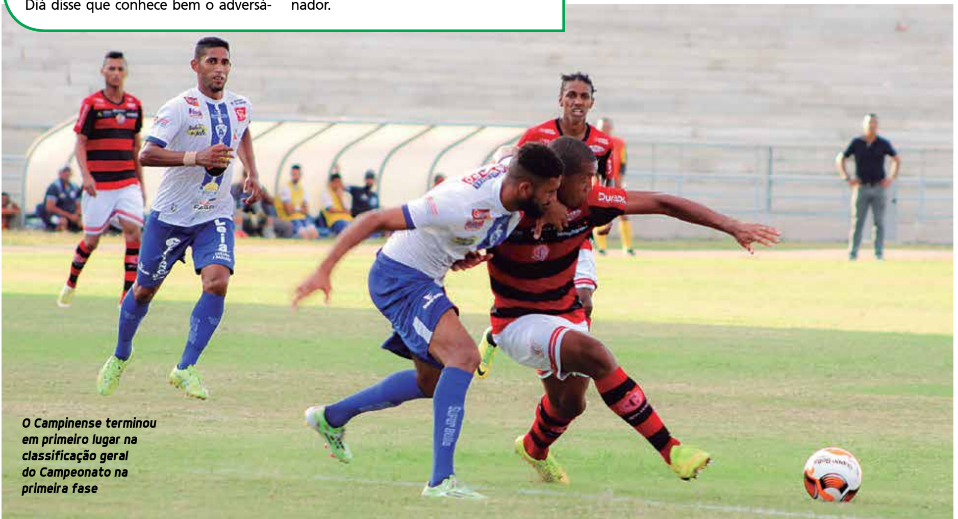
O Campinense terminou em primeiro lugar na classificação geral do Campeonato na primeira fase