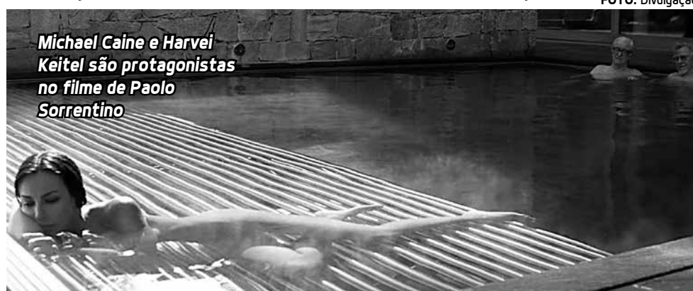
Michael Caine e Harvey Keitel são protagonistas no filme de Paolo Sorrentino

Em Youth a atmosfera é similar, mas, apesar dos arrependimentos, próprios dos balanços de vida, também fica evidente a serenidade transmitida pela pungente natu-