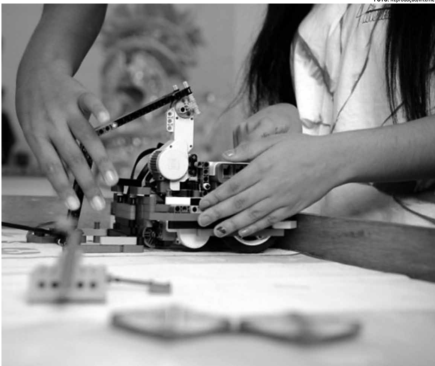
Em Educação e Saúde, mais de 70% dos graduados são mulheres; já em Engenharias e Ciências da Computação, elas não ultrapassam os 32%

Para competir na chamada economia cognitiva, os países precisam desenvolver o potencial de todos os seus cidadãos, garantindo que homens e mulheres desenvolvam suas habilidades e encontrem oportunidades para usá-las de forma produtiva. Porém, levantamentos realizados em níveis nacional e internacional mostram que ainda há barreiras para a plena participação das mulheres nessa missão e que as impedem, muitas vezes, de progredirem nos estudos e na carreira – principalmente em áreas ligadas à Matemática.