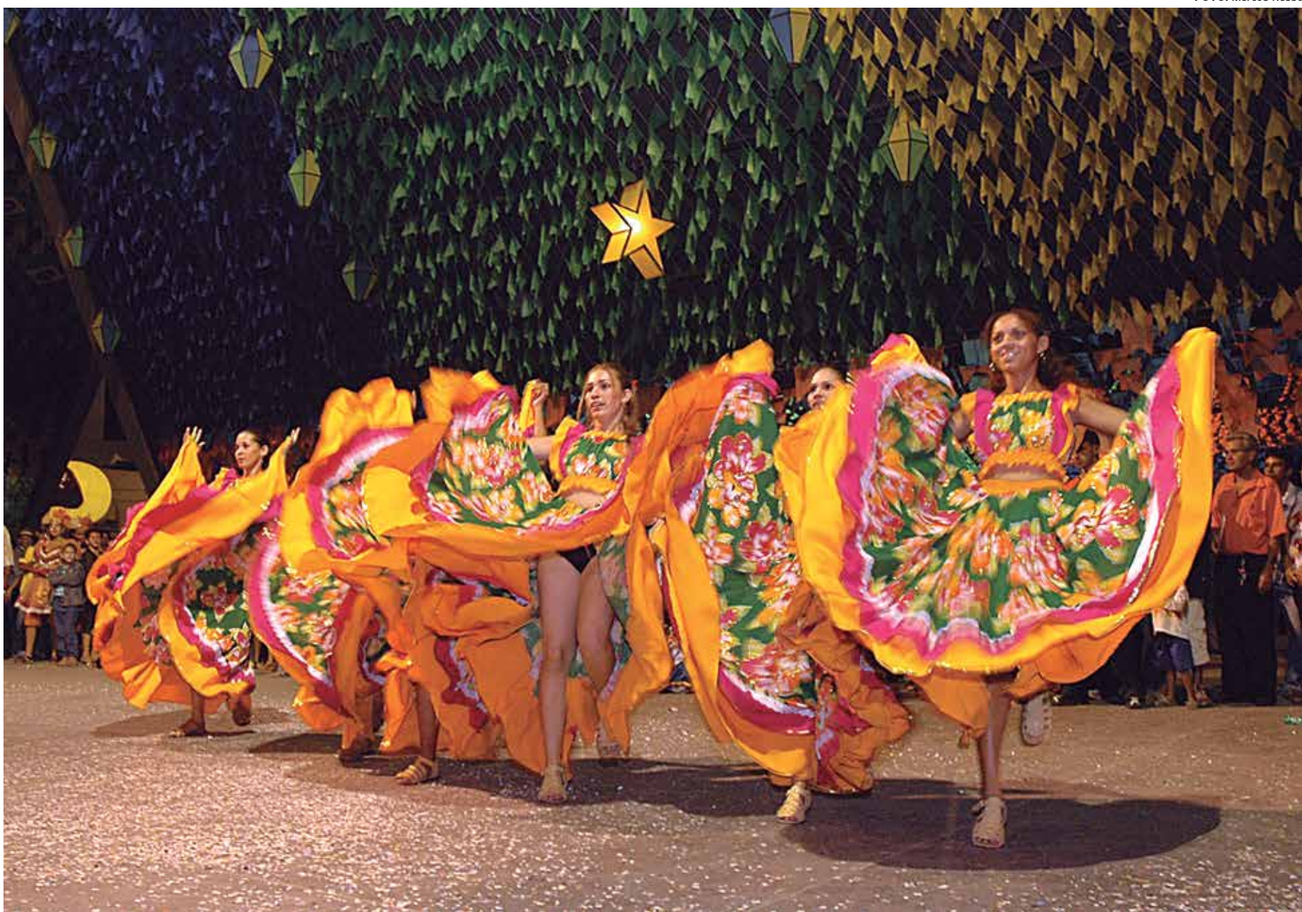
Maior São João do Mundo será um dos destaques da ação de divulgação da PBTur em dois eventos internacionais que começam hoje e seguem até amanhã em São Paulo