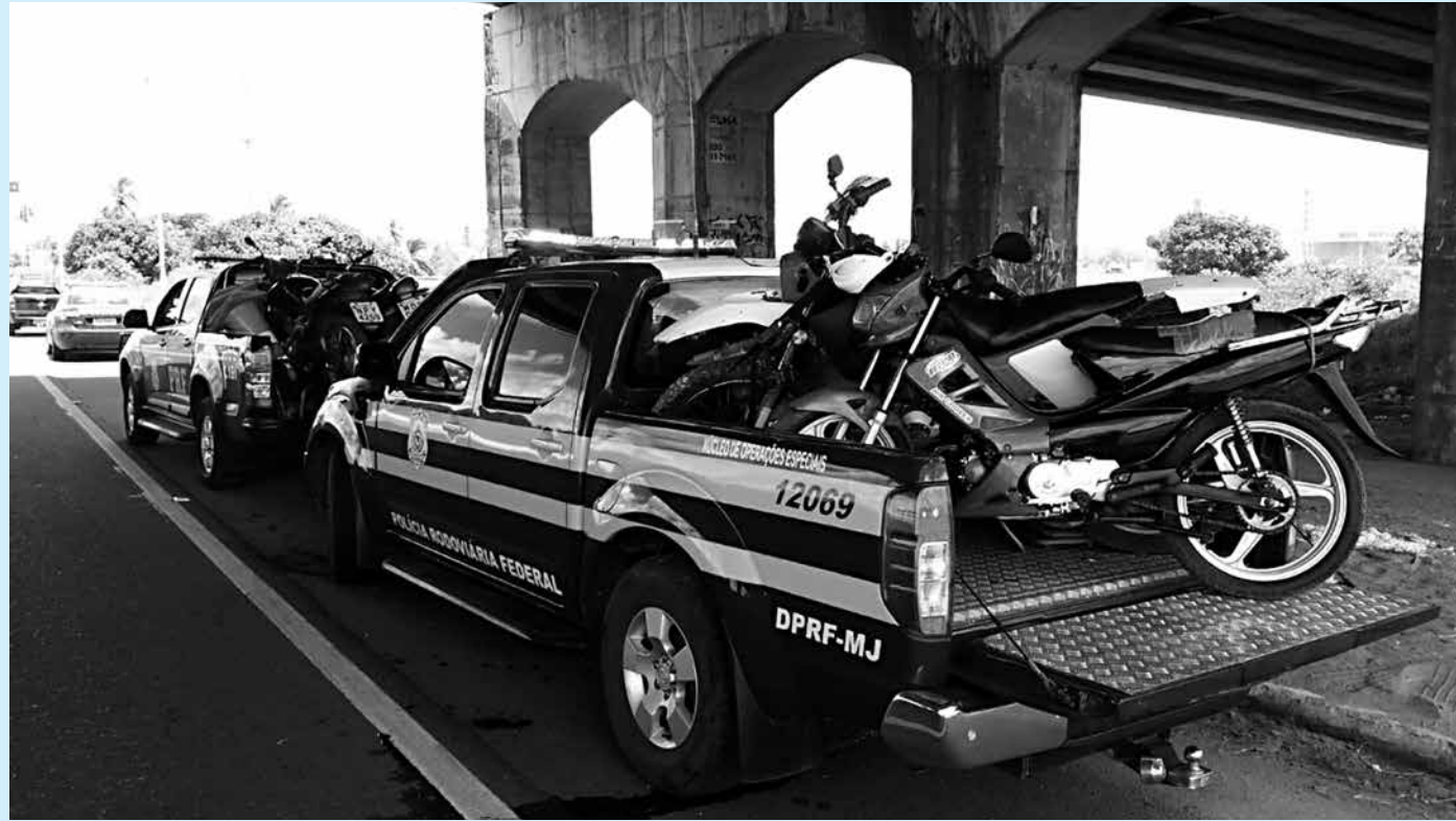
Polícia Rodoviária autuou 31 condutores de motocicletas pelo não uso de capacete e falta de habilitação e de licenciamento

A Operação Semana Santa em Campina Grande obteve como resultados: 83 apreensões de veículos autômatos, 247 notificações gerais, 15 notificações por embriaguez ao volante e sete acidentes com vítimas não fatais.