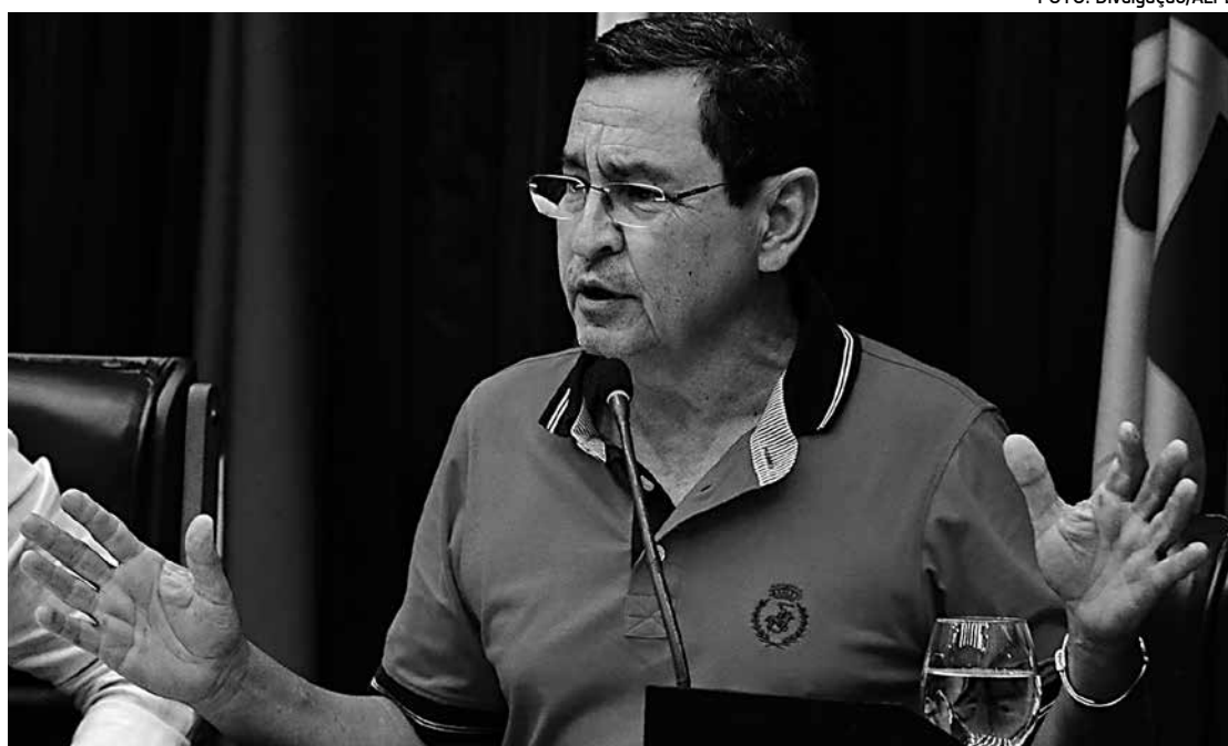
“O que está em jogo é muito mais que a defesa do Governo Federal”, ressaltou o deputado