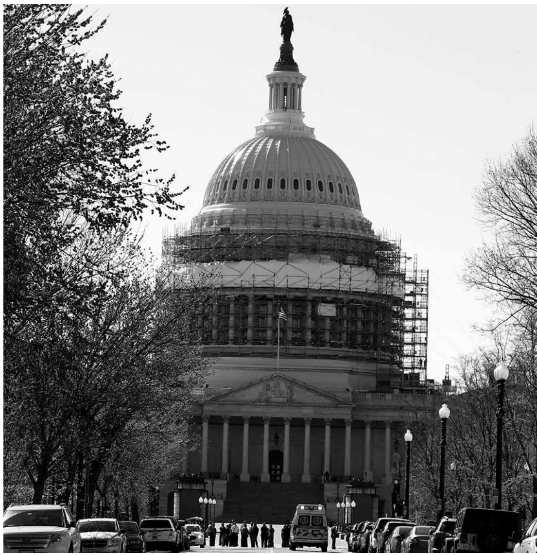
O Capitólio, nos Estados Unidos, foi fechado temporariamente como medida preventiva

No momento do incidente, jornalistas que disseram estar dentro do edifício postaram no Twitter que foram orientados pelo alto-falante a se manterem em seus lugares. A polícia orientou as pessoas que estavam do lado de fora do complexo para buscarem abrigo, disse a emissora MSNBC.