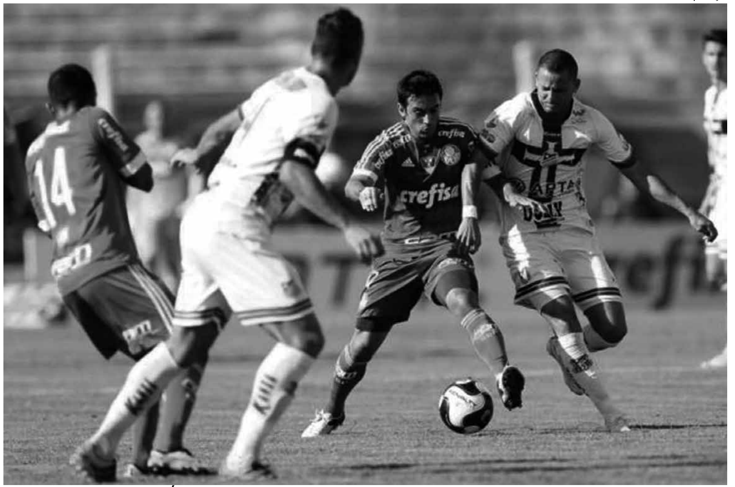
O Palmeiras levou de 4 a 1 do Água Santa e está ameaçado de não participar da fase decisiva do Campeonato Paulista de 2016

O problema é que o Palmeiras não aproveitou os troços dos rivais diretos, sendo derrotado em ambas rodadas: perdeu por 2 a 1 na quinta para o Red Bull e foi goleado pelo Água Santa, por 4 a 1, domingo.