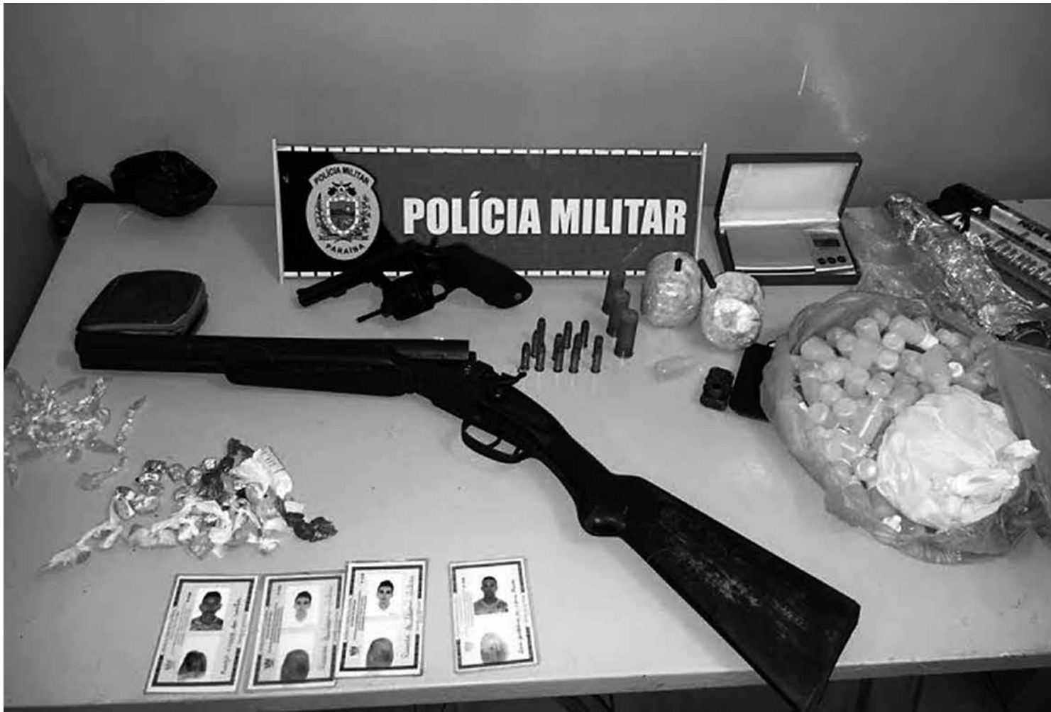
No feriadão, os policiais apreenderam armas de fogo, papéletes de maconha e cocaína, pedras de crack e comprimidos de anfetamina