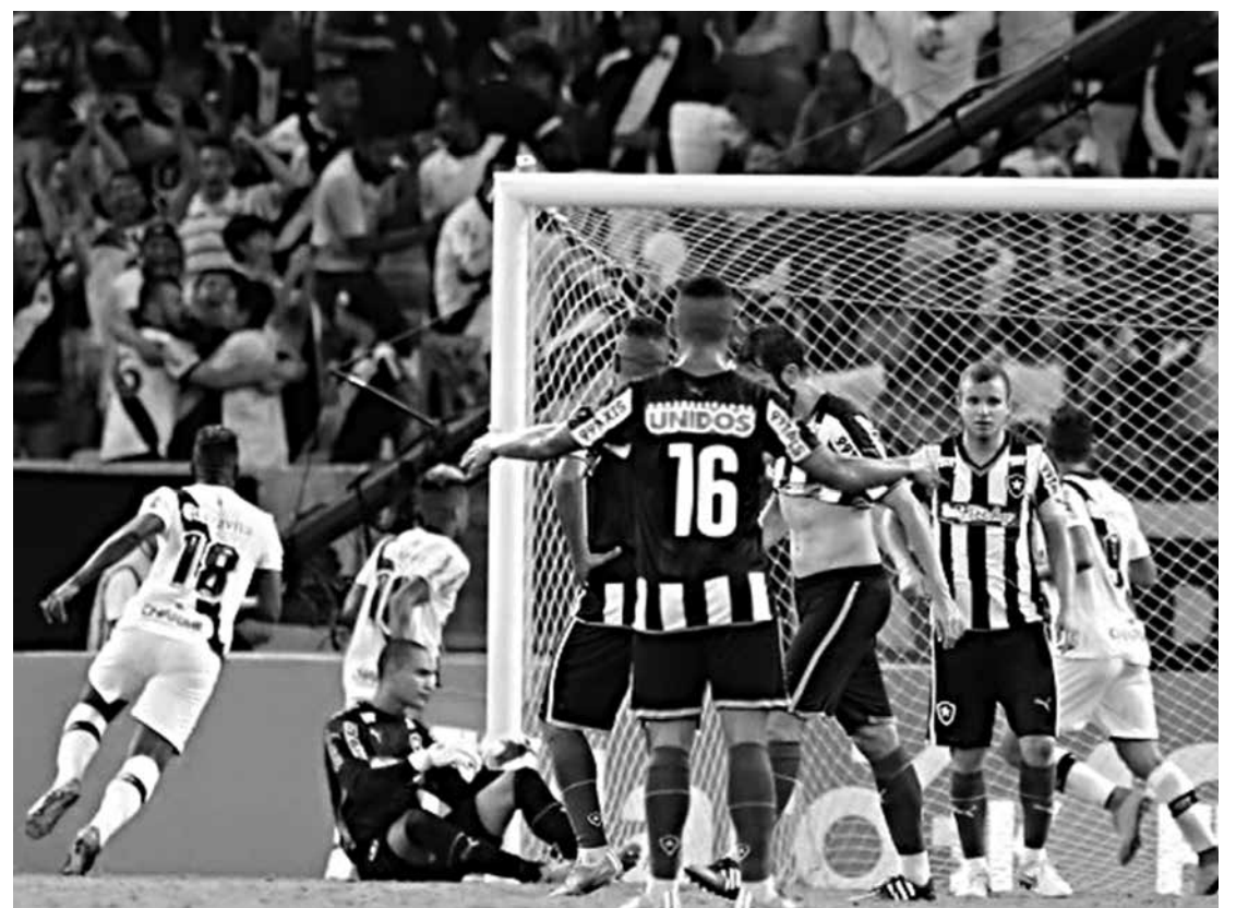
Desespero dos jogadores botafoguenses e mais uma comemoração vascaína no Certame Estadual

equipe até aqui na temporada. "Claro que tem explicação. Quando se tem tempo para trabalhar, se acaba obtendo bons resultados. Todas as oportunidades que eu tive como treinador para desenvolver um trabalho, tive bons resultados. Isso é fundamental e os jogadores entenderam. Falei com eles antes do jogo, na preleção, que o Vasco ressurgiu de um momento totalmente crítico. Ninguém acreditava nisso e eles trouxeram isso. Compraram isso. A outra razão é porque o ambiente entre eles é de cobrança", disse.