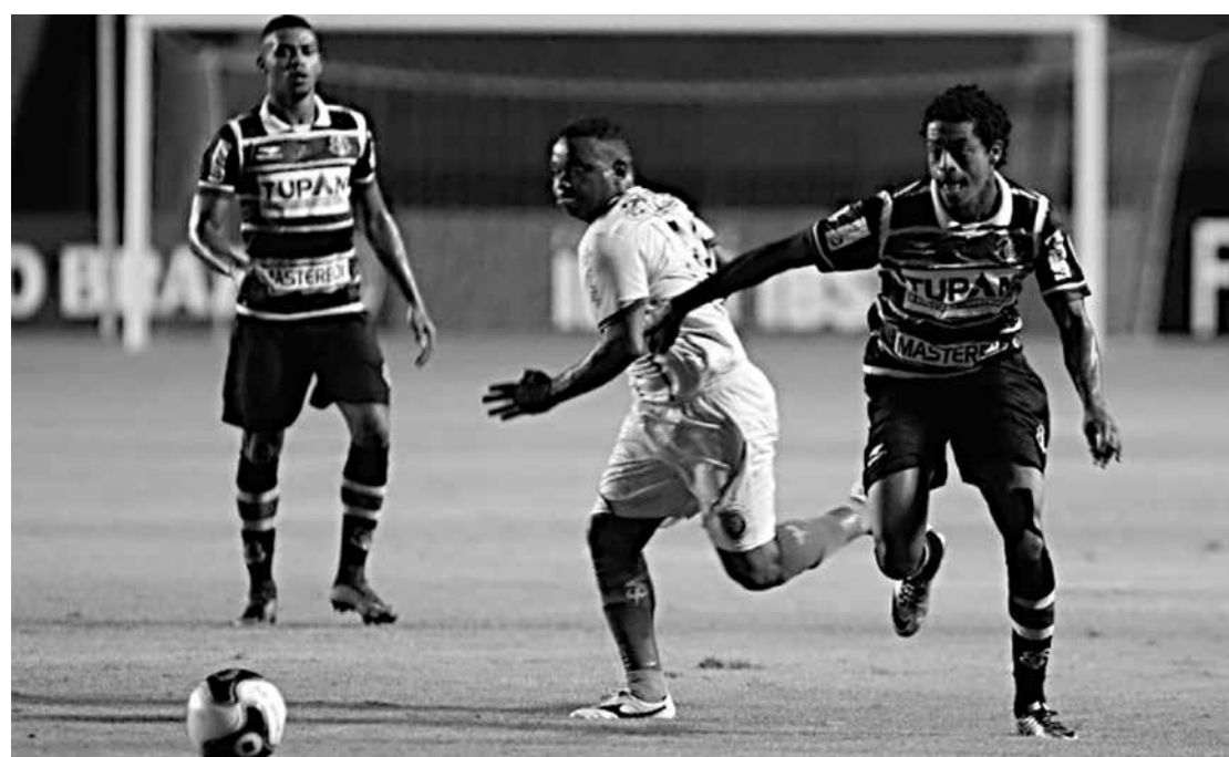
O Tricolor do Arruda recebe o Ceará amanhã no Arruda e no domingo vai jogar no Castelão

rado, o pior desempenho da temporada - o Fluminense é o segundo pior, com 1.173 sócios a menos. Se o ritmo atual de deserções se mantiver, o Fla terminaria o ano com pouco mais de 35 mil sócios. Bem longe dos 80 mil que queria. O programa era responsável por nada menos que 30 milhões das receitas rubro-negras no ano.