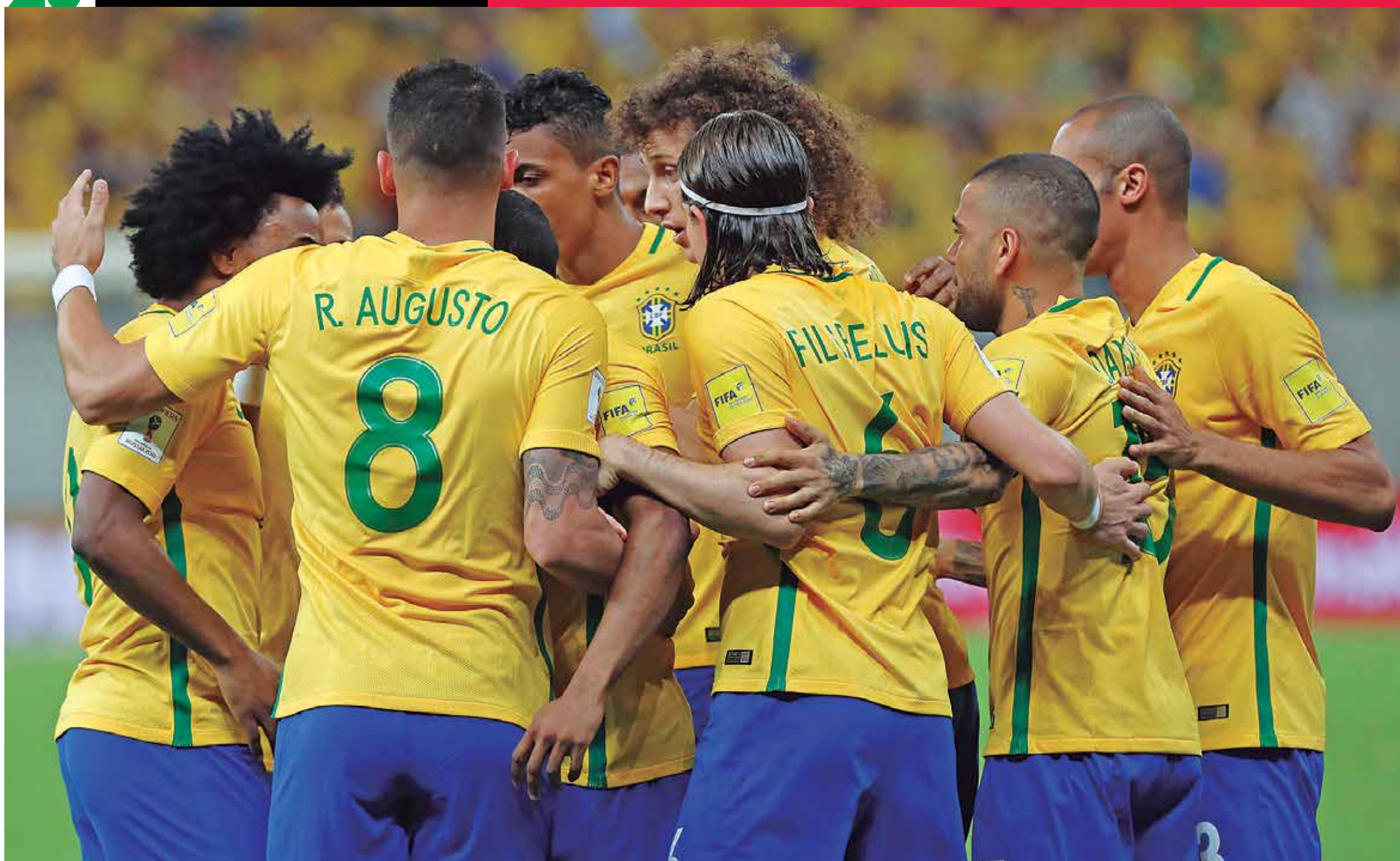
Jogadores da seleção no último jogo pelas eliminatórias contra o Uruguai quando foram surpreendidos no empate de 2 a 2. Hoje a seleção não terá o atacante Neymar e o zagueiro David Luiz, suspensos