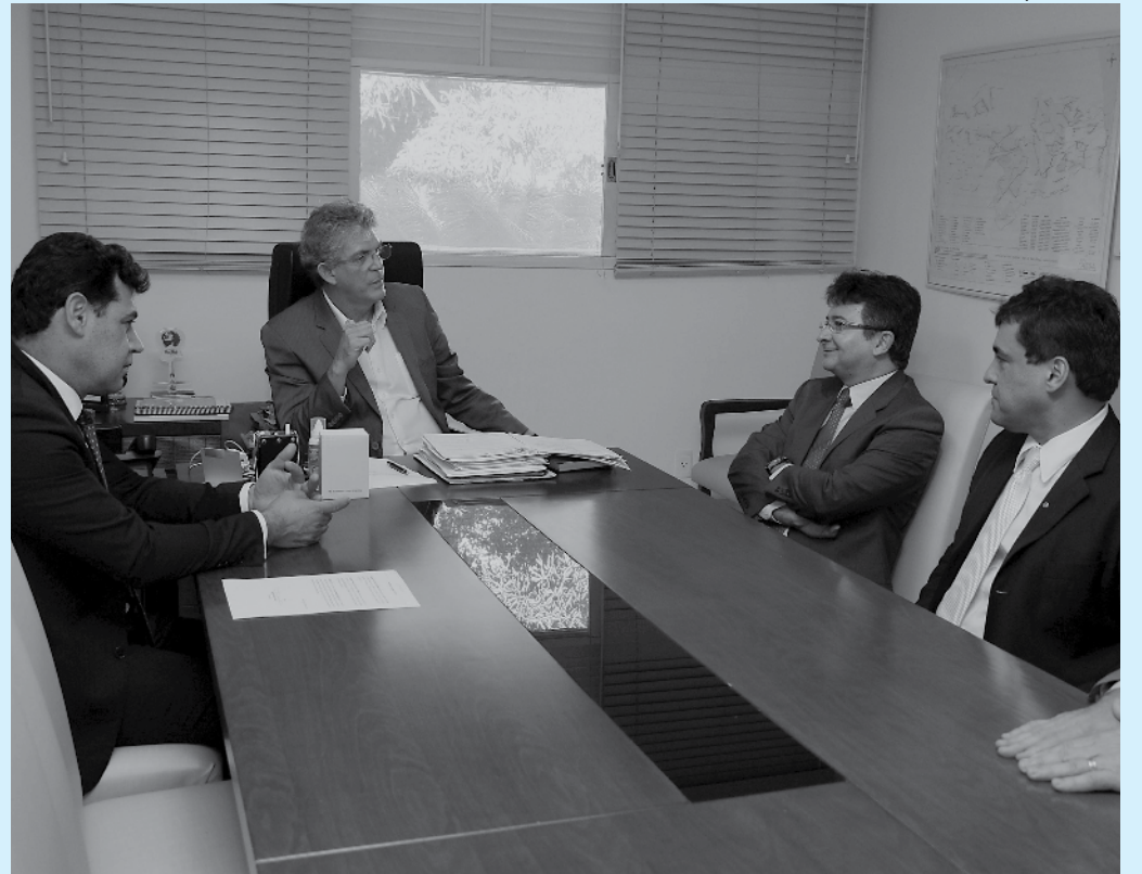
No encontro, o governador Ricardo Coutinho destacou a cooperação entre os poderes