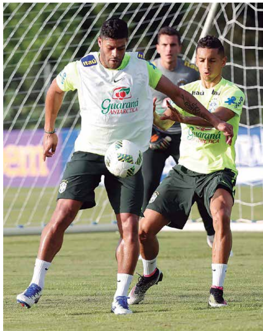
O paraibano Hulk participando de treino da seleção. Jogador deve ficar no banco

A equipe canarinho chegou a estar vencendo por 2 a 0. Levou o empate em falhas do zagueiro David Luiz e por pouco não so-