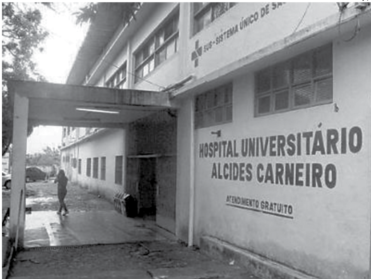
Hospital Alcides Carneiro, no Campus I da Universidade Federal de Campina Grande - UFCG, precisa se reestruturar para atender finalidade

Inaugurado em 1950 para funcionar como Hospital do Ipase (Instituto de Pensões e Aposentadoria dos Servidores Federais), o hospital é uma construção horizontal. Fica localizado entre as Ruas Carlos Chagas, Almeida Barreto, Pedro I e Dr. Chateaubriand, no bairro de São José. As únicas alternativas para expandir o hospital, segundo o diretor-geral Homero Gustavo, seriam: verticalização do prédio; ou absorção das áreas da antiga Escola de Auxiliares de Enfermagem e da Casa do Estudante. "A primeira, pertencente ao Governo do Estado, está desativada; e a segunda, vinculada a uma fundação, está abandonada e servindo como espaço para consumo de droga