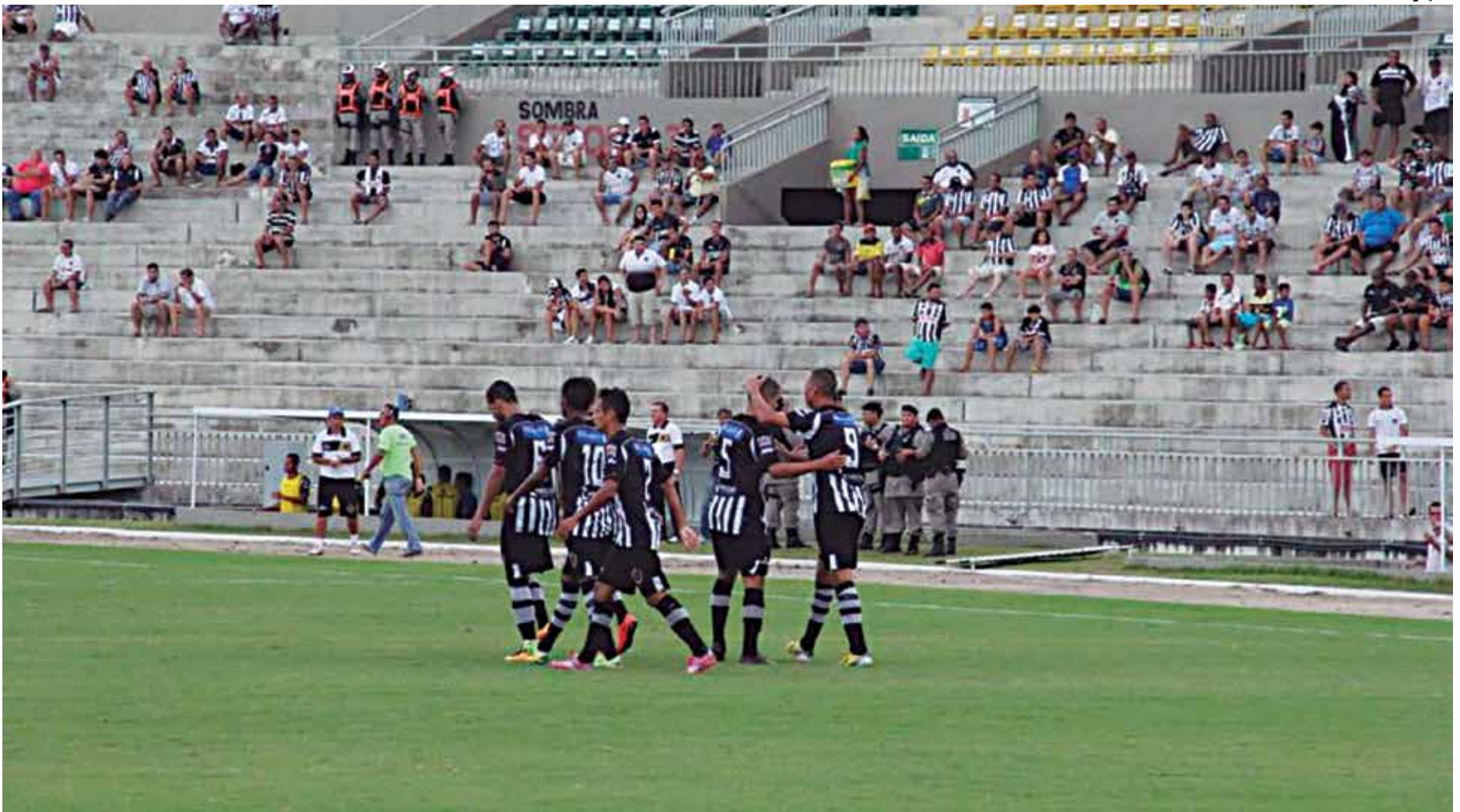
Poucos torcedores foram assistir a vitória do Botafogo sobre o Auto Esporte no domingo passado quando goleou por 5 a 1 e terminou em segundo na classificação geral

Nesse jogo contra o Linense, o Botafogo tem a vantagem de jogar por um empate sem gols para eliminar o time paulista. É que na primeira partida entre as duas equipes, disputada em Lins, no interior paulista, houve um empate de 1 a 1.