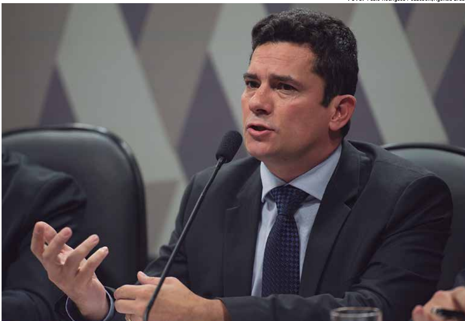
Moro decidiu enviar ao STF a lista da Odebrecht com pagamentos a políticos porque há nomes de autoridades com foro privilegiado

O material teve sigilo decretado no último dia 23. Segundo a decisão, por conter nomes de pessoas com foro privilegiado, o Ministério Público Federal (MPF) solicitou ao juiz que os processos referentes à Operação Acarajé e também à Operação Xepa fossem remetidos ao STF para apuração. O MPF pede ainda que seja mantida em Curitiba, com o juiz Moro, a parte do processo referente aos paga-