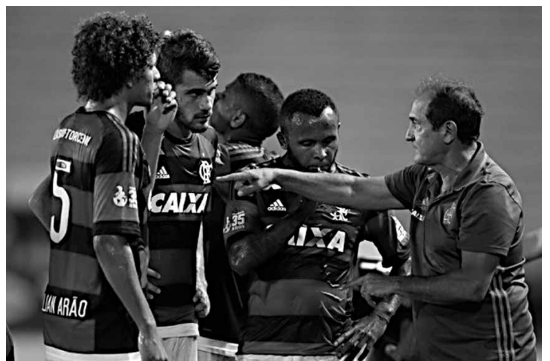
No último fim de semana, o Flamengo voltou a decepcionar e perdeu para o Volta Redonda: 1 a 0

Mesmo sem estar garantido no cargo até o primeiro confronto do mata-mata regional, o treinador provisório afirmou que, apesar do Santa Cruz estar há cinco partidas sem vencer, somando estadual e regional, o momento não é para desespero.