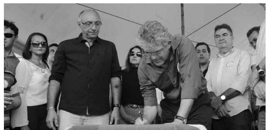
Governador assinou autorização para construção de um sistema de abastecimento