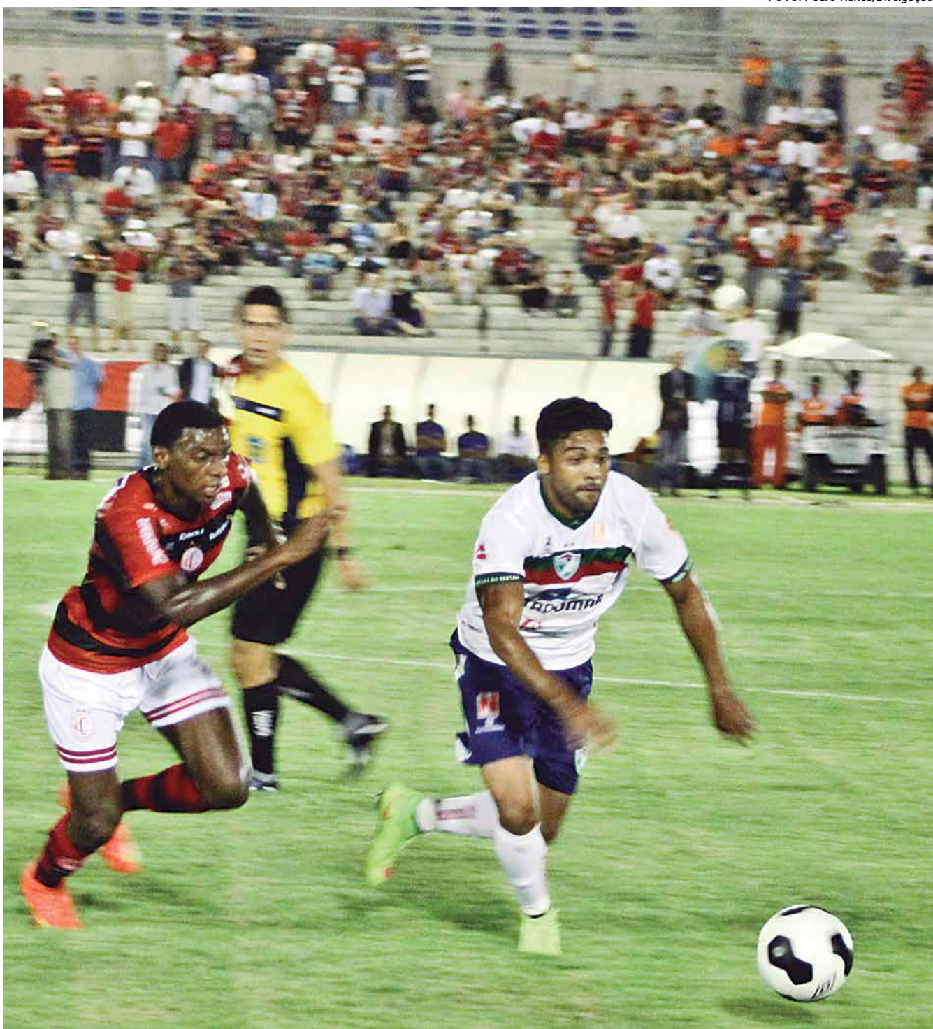
Lance da partida realizada no Amigão pela primeira fase quando o Campinense venceu o Salgueiro por apenas 1 a 0