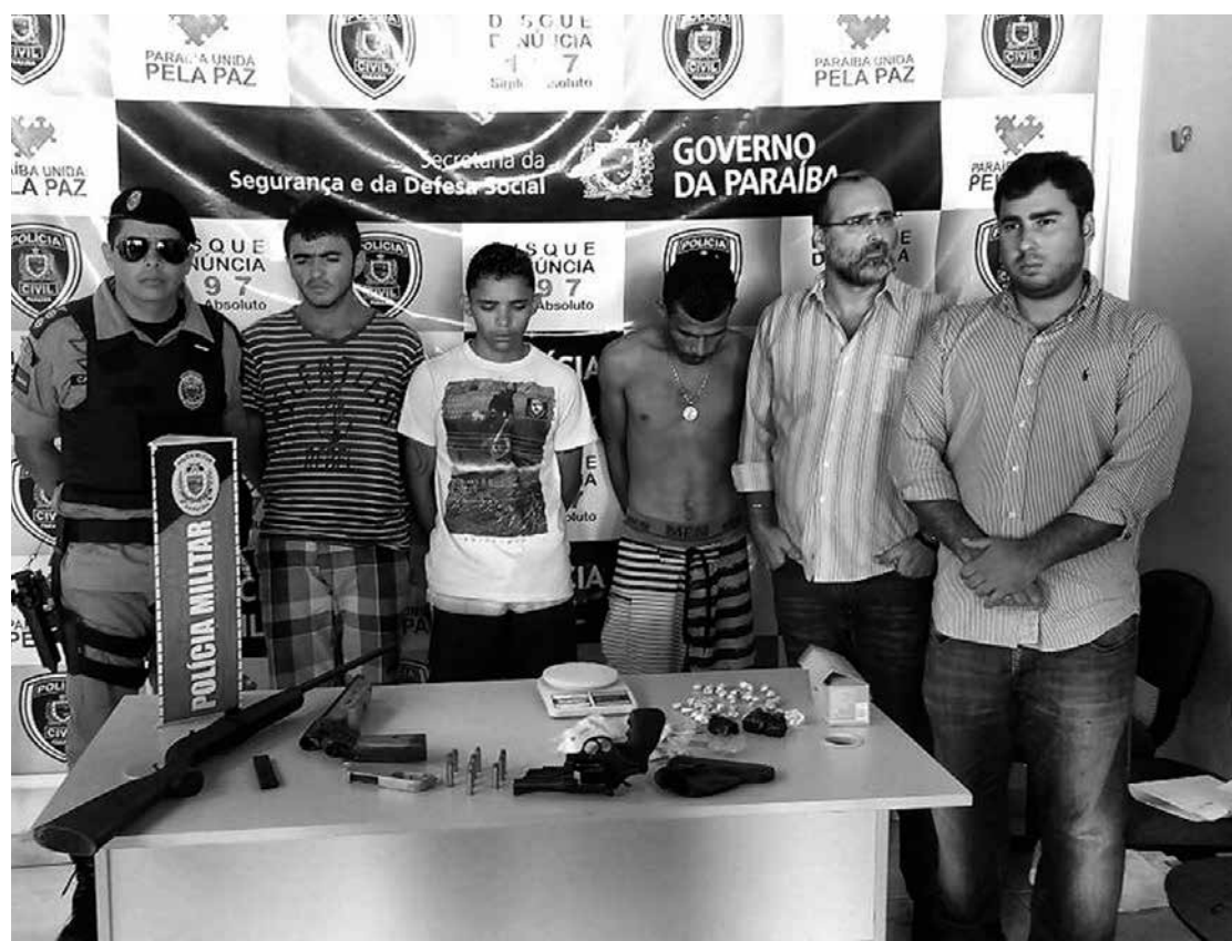
Os três suspeitos foram apresentados ontem pela polícia e encaminhados ao Presídio Regional

As armas e a droga foram levadas para o Instituto de Polícia Científica para ser realizado o trabalho de perícia