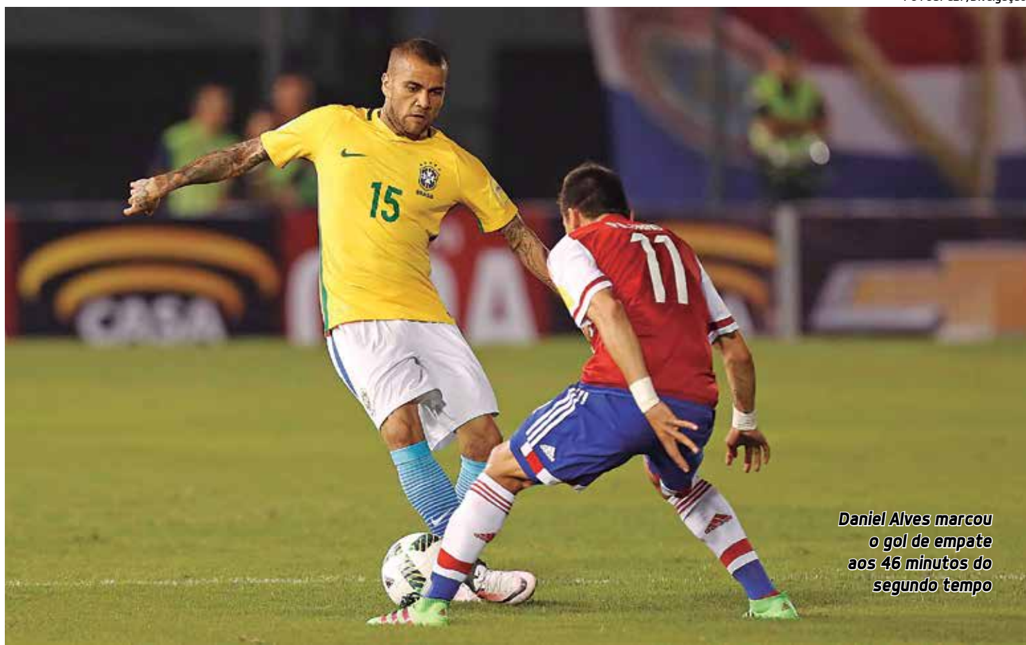
Daniel Alves marcou o gol de empate aos 46 minutos do segundo tempo

A Seleção Brasileira só volta a atuar nas Eliminatórias no dia 2 de setembro quando enfrenta o Equador na altitude de La Paz.