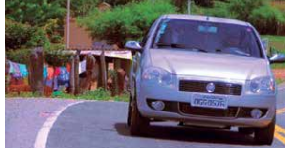
Governo investiu com recursos próprios mais de R$ 10 milhões na obra, que beneficiará diretamente 9 mil moradores da região