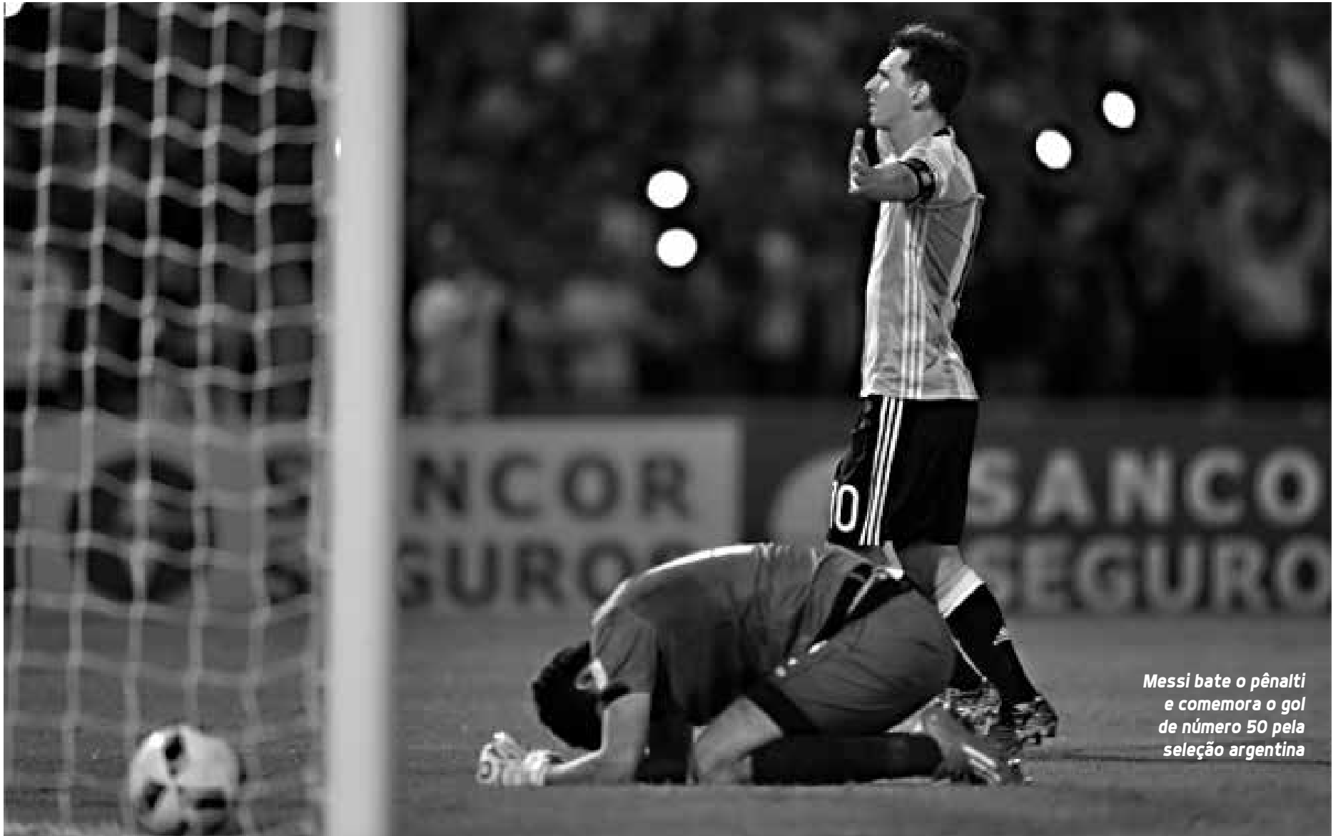
Messi bate o pênalti e comemora o gol de número 50 pela seleção argentina

De acordo com o jornal As, os quilômetros acumulados pelo elenco do Barça com viagens nessas datas Fifa foram de 189 mil, contra 89 mil do time de Madri.