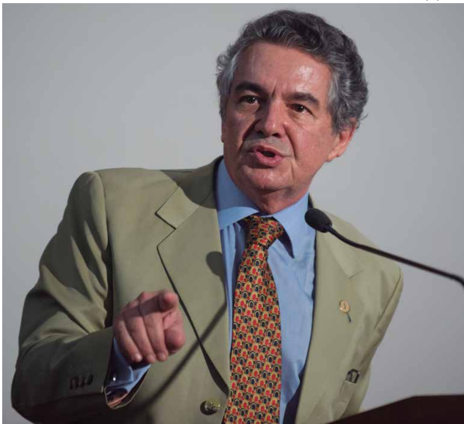
O ministro do STF, Marco Aurélio de Mello, disse que o eventual afastamento de Dilma não vai resolver a crise política instalada no País

“Essa evidência mostra, até agora, a insuficiência dos esforços legislativos para erigir um sistema praticável, equilibrado e eficaz para o tratamento dos problemas que assombram o modelo constitucionalizado de pagamento de débitos judiciais por entes federativos”, disse, em seu parecer.