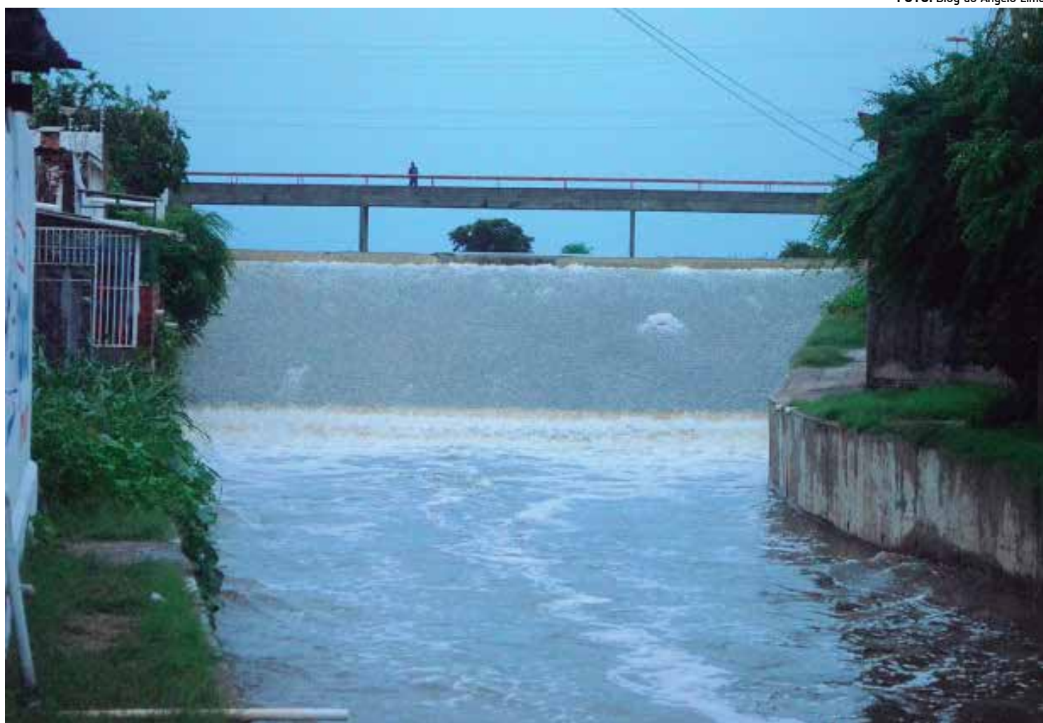
Açude Grande, localizado no centro da cidade de Cajazeiras, voltou a sangrar por causa das últimas chuvas, animando a população

Já Engenheiro Avidos, que abastece Cajazeiras recebeu pouco mais de um milhão de metros cúbicos. Seu volume ainda é crítico, apenas 6,6% da capacidade de estoque, mas a barragem Boa Vista, seu principal afluente, construída no projeto da transposição, já acumula muita água, e se constitui numa reserva importante.