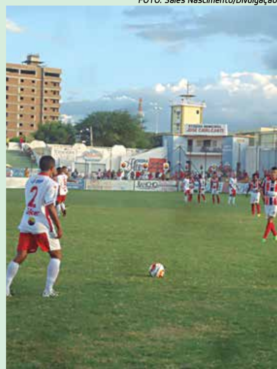
Esporte de Patos e Santa Cruz na 1ª rodada

Segundo os dirigentes destes clubes, o principal motivo da falência das agremiações é a falta de patrocínio. Com a crise, os clubes não conseguiram o apoio que esperavam da iniciativa privada, e a verba oriunda do programa do Governo do Estado, Gol de Placa, ainda não foi repassada, este ano. O problema deverá ser resolvido hoje, numa reunião do Governo do Estado com os dirigentes dos clubes. O encontro será às 11 horas, na Granja Santana. (IM)