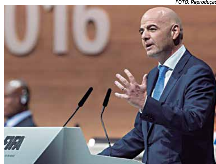
O presidente da Fifa, Gianni Infantino falando sobre mudanças

"Minha proposta para a América do Sul é de cinco (vagas) asseguradas e talvez mais uma disputada em campo", disse em referência a outra vaga para a região. Ele não deu detalhes de como seriam definidas as oito vagas adicionais.