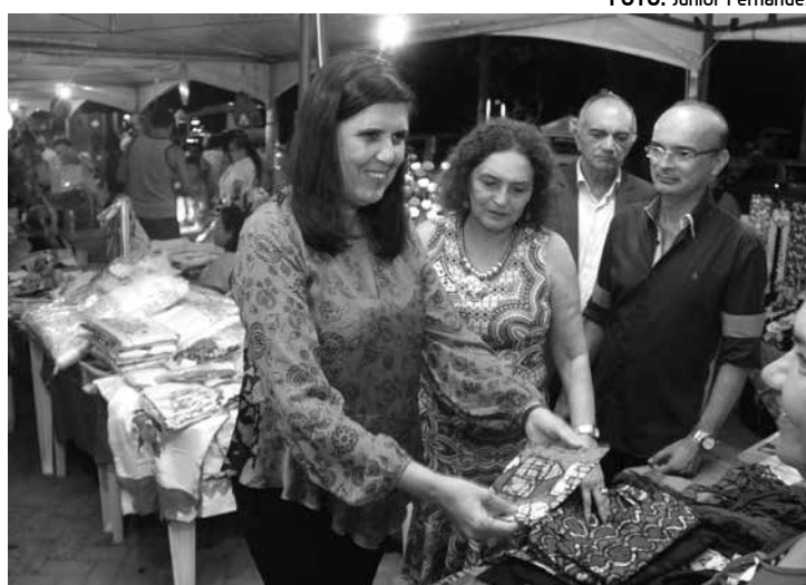
Vice-governadora Lígia Feliciano participou da abertura do evento

Durante a solenidade, Lígia destacou a alegria de participar do evento que enaltece a cultura local, no Mês da Mulher. "No mês dedicado a nós mulheres, o governo dá um grande incentivo a estas artesãs proporcionando a todas elas a independência