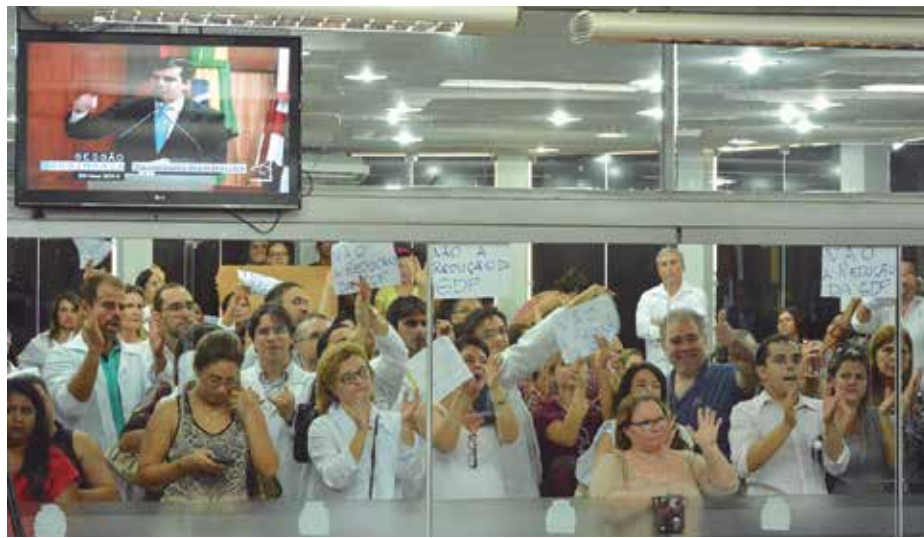
Profissionais das áreas de Educação e Saúde foram pedir o apoio dos vereadores