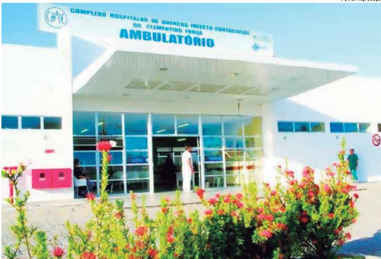
Hospital Clementino Fraga, em João Pessoa, é referência no Estado no tratamento das doenças transmissíveis

infecto-contagiosa causada por uma bactéria que afeta principalmente os pulmões, mas também pode ocorrer em outros órgãos do corpo, como ossos, rins e meninges (membranas que envolvem o cérebro). Mas a apresentação pulmonar, além de ser mais frequente, é a mais relevante para a saúde pública por ser a que é mais responsável para a disseminação da doença.