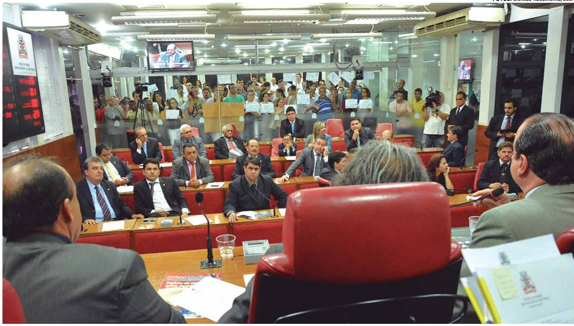
A sessão na Câmara Municipal de João Pessoa foi bastante movimentada na manhã desta quarta-feira, com a presença de servidores das áreas de saúde e educação