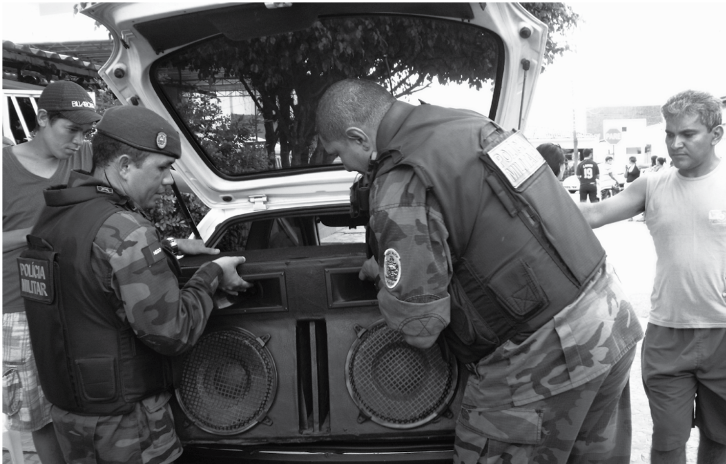
Quando é constatada a poluição sonora, a Polícia Ambiental conduz os equipamentos à Sudema, onde ocorre a tramitação do processo

Quando autuados, caso seja constatado o uso abusivo de som (poluição sonora), é elaborado um auto de infração contra o responsável com punições e reclusão de