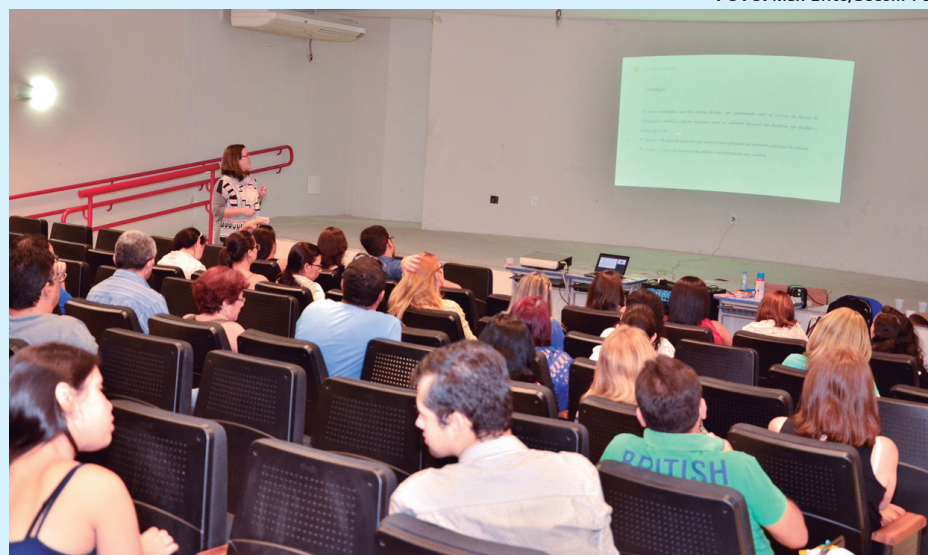
Professores e coordenadores pedagógicos participam do "Projeto de Vida" para ECIs e ECITs

Ao longo dos três dias de formação, os participantes terão um aprofundamento nas duas variáveis que compreendem o "Projeto de Vida". A primeira diz respeito à identidade, ou seja, quanto mais o jovem se conhece (experimenta suas potencialidades individuais, descobre seus gostos e aquilo que sente prazer em fazer), maior será sua capacidade de elaborar seu projeto. A segunda é o conhecimento da realidade. Quanto mais o jovem conhece a realidade em que está inserido, compreende o funcionamento da estrutura social. Tanto com seus mecanismos de inclusão e exclusão, quanto com os limites e possibilidades abert-