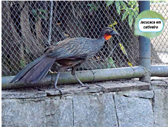
Jacucaca em cativeiro