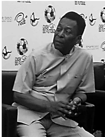
O Rei nos tempos atuais e quando tinha apenas 15 anos no time santista