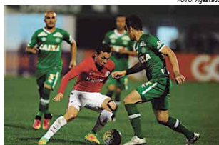
Chapecoense busca a meta de 45 pontos no Brasileiro