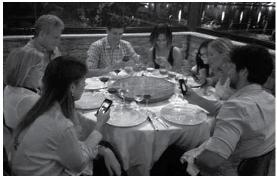
Nem na mesa a conversa tem sido possível. Os pratos são um detalhe