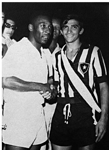
Pelé com Dissor, do Botafogo-PB, em amistoso na Paraíba