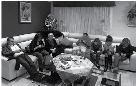
Em visita à avó, para banir remorsos, filhos e netos não largam o celular