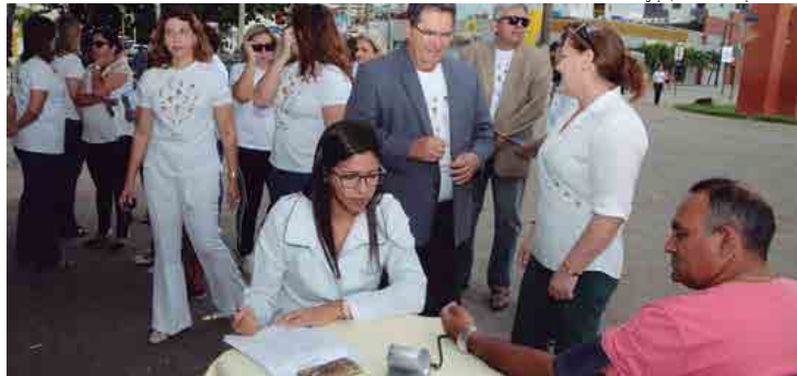
Equipe médica do TJPB participou da campanha de conscientização de adoção de crianças e realizou exames de verificação de pressão na orla

Quase 92% das crianças têm entre 7 e 17 anos, enquanto 91% dos candidatos a pais preferem crianças até seis anos, segundo dados do CNJ