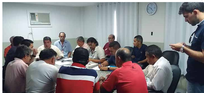
Reunião que definiu os detalhes da competição aconteceu na última quarta-feira na sede da Federação com representantes dos 10 clubes.

Os dois clubes que farão as finais do campeonato se classificarão para a Primeira Divisão do Paraibano de 2018. Eles se juntarão ao Botafogo-PB, Treze, Campinense, Atlético, Sousa, Auto Esporte, Serano e CSP, que se mantiveram na elite do futebol estadual, após a realização do Campeonato Estadual deste ano.