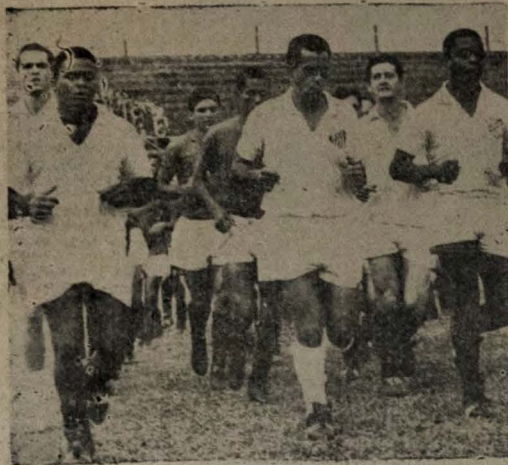
VALORES — Acima alguns valores do Santos paulista que, esta noite no "Pacaembu", enfrentará a equipe da Portuguesa pelo "Robertão".