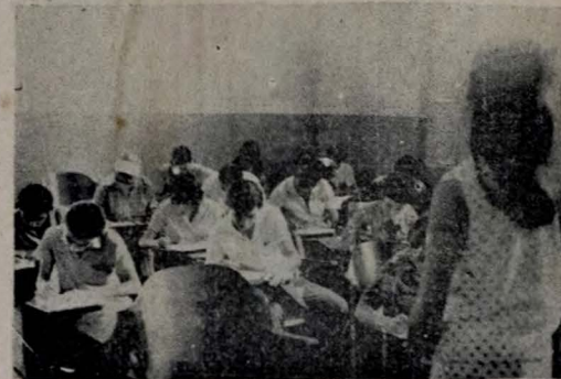
TESTES Divididos em três grupos, de acordo com o grau de instrução escolar, estão sendo realizados na Faculdade de Ciências Econômicas da UFP os testes para absorção regular dos prolaboristas na administração municipal. Ontem, 83 servidores compareceram às provas dos grupos I e II. Hoje, cerca de 180 farão os testes do grupo III. (NOTÍCIA NA 3a. PAGINA)

As obras compreendem além da adução até a cidade a construção do reservatório do corte branco com a interligação do sistema geral de distribuição do líquido à capital.