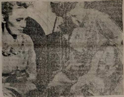
Patty Duke, "O Milagre de Ana Sullivan"

Orientação da Associação dos Críticos Cinematográficos da Paraíba