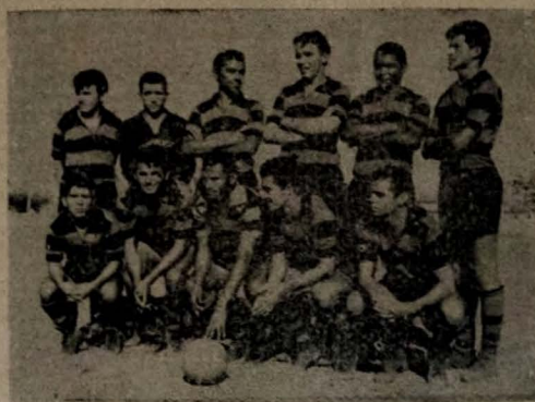
CAMPINENSE — Domingo o Campinense, no clichê, receberá a visita do América do Recife, no único encontro pelo Torneio "P-P".

De qualquer maneira, com ou sem o ABC, o Botafogo não realizará nenhuma partida de validade de pelo quadrangular do presente esta semana, limitando-se apenas a realizar um amistoso, contra a apresentação do Guarabira.